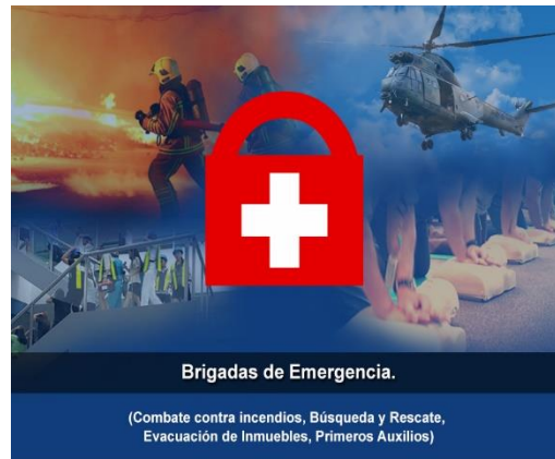
Brigadas de Emergencia.

(Combate contra incendios, Búsqueda y Rescate, Evacuación de Inmuebles, Primeros Auxilios)