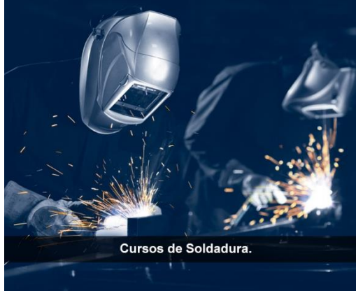
Cursos de Soldadura.