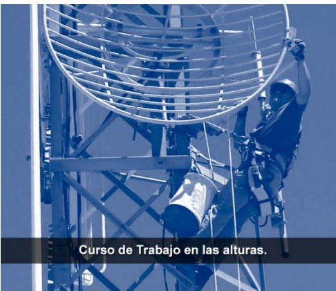
Curso de Trabajo en las alturas.