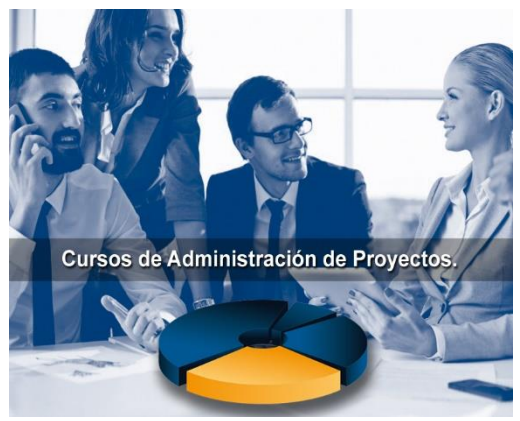
Cursos de Administración de Proyectos.

(Combate contra incendios, Búsqueda y Rescate, Evacuación de Inmuebles, Primeros Auxilios)