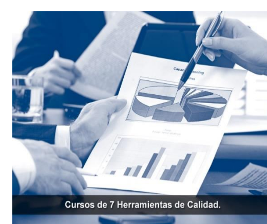
Cursos de 7 Herramientas de Calidad.