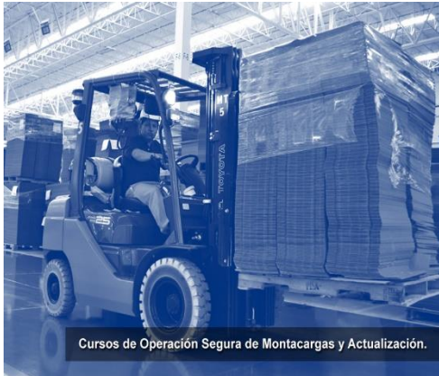
Cursos de Operación Segura de Montacargas y Actualización.