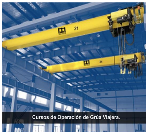
Cursos de Operación de Grúa Viajera.